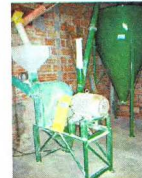
Secagem e Armazenagem de grãos